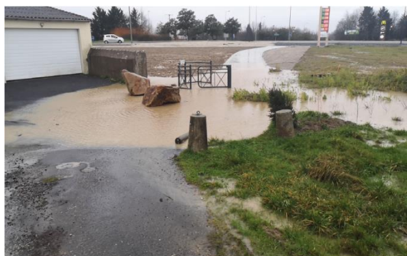
Impasse du Pointu le 27 décembre 2020

environ 10% de la surface totale, posent déjà des problèmes pour le voisinage. D'une part, il y a eu une grosse inondation juste au niveau de l'entrée piétonne de la ZAC. Un compteur électrique a été noyé et Enedis n'a pas pu intervenir immédiatement à cause du risque d'électrocution. La mairie de Vallet s'est empressée de faire installer une grille eaux pluviales. Reste que le sol a été réhaussé pour permettre l'accès vers le rond-point, créant ainsi une cuvette. À voir si la fameuse grille va suffire en cas d'orages.