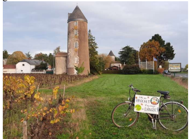
A l'entrée de Vallet, les vignes, le moulin Honoré et le panneau « MacDo Vallet recrute »

occasion donc pour donner de la visibilité à notre lutte. Pour la catégorie « Vélo et humour », c'est le nombre de likes sur Facebook qui déterminera le gagnant et nous allons présenter une photo dénonçant la ZAC du Brochet. Pour le thème « Vélo et paysages », le gagnant sera désigné par le bureau communautaire et on voudrait présenter plusieurs photos pour interpeler sur la bétonisation de ces terres agricoles.