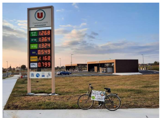
Magnifique entrée de la ZAC du Brochet avec ses espaces verts (photo du 14 octobre 2020)

Pour donner plus de poids à cette action, vous pouvez participer au concours photo jusqu'au 30 octobre. N'hésitez pas à nous écrire pour en savoir plus : Laissebeton@protonmail.com .